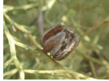
L-iżvilupp tal-koni nisa.

Is-sigra tal-Għargħar hija waħda mill-ftit koniferi li jirnexxielha terġa' tkabbar il-friegħi fuq iz-zokk tagħha jekk tiġi mqaççta. L-injam tal-Għargħar huwa ta' lewn aħmar u huwa meqjus bħala injam prezzjuż li jintuza fi bçejeç tal-għamara ornamentali. Din is-sigra tipproduçi rezina magħrufa bħala 'sandarac' li tintuza l-aktar biex minnha jsir verniç li jintuza biex jiġu priservati l-pitturi. Fil-pajjizi Għarab din ir-rezina tintuza bħala incens.